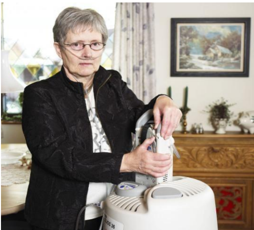
Figur 3 - Påfyldning af lille enhed med flydende ilt

Flydende iltbehandling består af en stor stationær beholder som indeholder flydende ilt (minus 183 °C) til 1-4 ugers forbrug. Fra den store stationære beholder kan man efter behov tappe flydende ilt til en bærbar beholder. Beholderne vejer fra 1,6-3,5 kg og rummer ilt til 3-11 timer ved flow på 1,5 l/minut. Generelt anvendes flydende ilt til de mest mobile patienter. Dog kan enkelte patienter ikke håndterer systemet, og hvis patienten bor i en etageejendom uden elevator, kan det være besværligt at levere de ca. 50 kg tunge stationære beholdere.