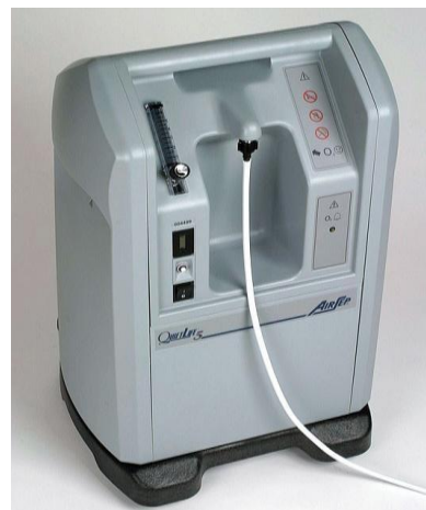
Figur 1- Iltkoncentrator

Ilt fra koncentrator er i Danmark den hyppigst anvendte form for hjemmeilt. De mest almindeligt anvendte koncentratorer er stationære med en vægt på 15-25 kg. De er tilsluttet lysnettet og kan opkoncentrere den atmosfæriske ilt til renhedsgrader på 90-98% ved iltflow op til 9 l/minut. Ved højt flow falder iltkoncentrationen og maskinen larmer mere. Ved endnu højere flow må 2 koncentratorer anvendes. Patienterne er forbundet til koncentratoren med en tynd plastikslange på typisk 20-30 m, så de kan færdes i hjemmet. Iltleverandøren står for regelmæssig serviceeftersyn med ca. 3 måneders intervaller. Bærbare iltkoncentratorer er udviklet med vægt helt ned til ca. 3 kg. De er udstyret med genopladeligt batteri som kan drive koncentratoren i ca. 2 timer med iltflow op til 3 l/min, der kun leveres under inspirationen (indbygget iltsparer). Der er udviklet koncentratorer, der kan komprimere ilt til transportable beholdere, men de kan være svære at betjene og er ikke særligt udbredte. Koncentratorerne udsender en jævn summen med en lydstyrke på 40-55 dB. Udgiften fra strømforbruget til koncentratoren refunderes fra det offentlige.