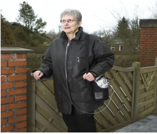
Figur 2- Flydende ilt via bærbar enhed